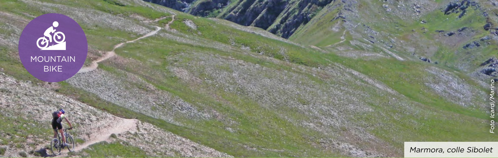
Marmora, colle Sibolet